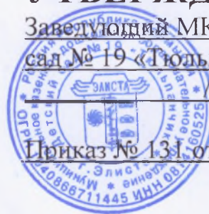
График работы специалистов МКДОУ «Детский сад № 19 «Тюльпанчик».